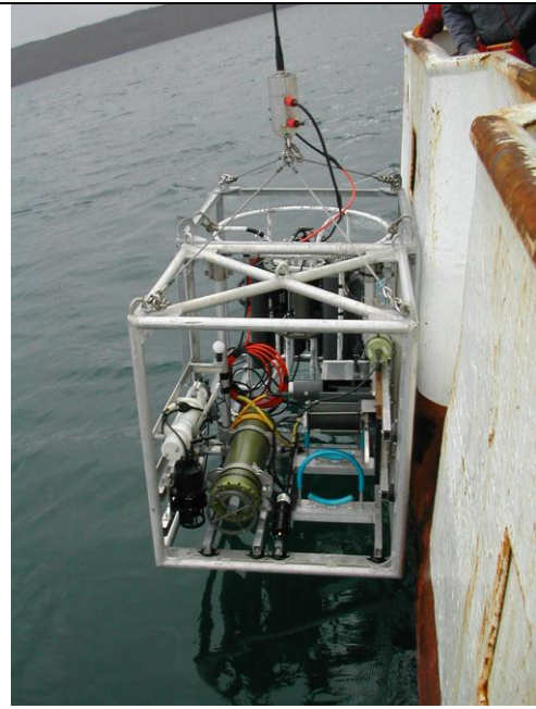
Mise à l'eau du profileur granulométrique